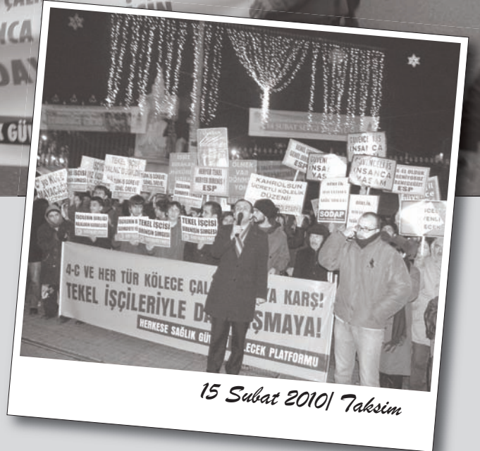
15 Şubat 2010 / Taksim