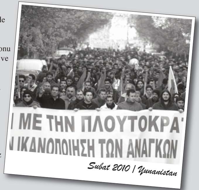
Şubat 2010 | Yunanistan

Yunanistan hükümeti, Avrupa Birliği'nin desteğini alabilmek için büyük çaba gösterirken, AB'nin güvenini kazanmak amacıyla açıkladığı kemer sıkma önlemleri ülkede şimdiden büyük tepkilere yol açıyor ve önümüzdeki süreçte işçi ve emekçilerin daha kitlesel, daha yaygın ve militan mücadelelere kalkışacağı ise kesin.