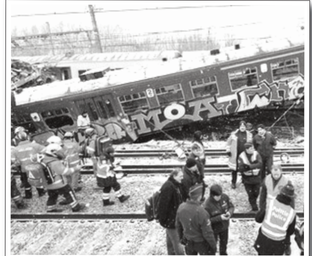
Şubat 2010 | Belçika

Alman havayolu şirketi Lufthansa'da çalışan pilotlar grev kararı aldı. Lufthansa bünyesinde çalışan pilotlar, 9 yıl aradan sonra ilk kez geniş çaplı bir eylem kararı aldı. Alman Kokpit Birliği, birliğe üye pilotların çoğunluğunun eylem kararını desteklediğini duyurdu. Haklarının genişletilmesini ve iş güvencelerinin artırılmasını isteyen pilotlar, ayrıca maaşlarına da yüzde 6 oranında zam talep ediyorlar.